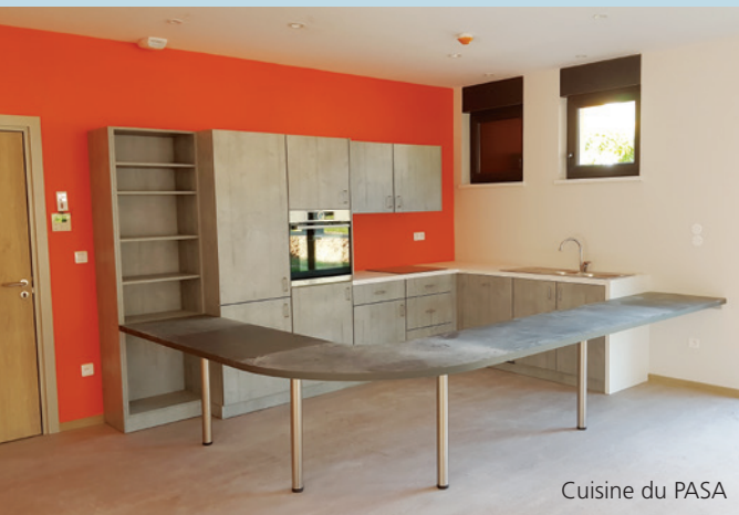
Cuisine du PASA

Il est à noter, que l'EHPAD des Hêtres a profité de la construction du PASA pour ajouter 12 nouvelles chambres individuelles en vue de supprimer les dernières chambres doubles encore existantes. Ainsi, à compter du 1 er octobre, l'EHPAD pourra organiser le déménagement de ces résidents. Chacun aura donc sa propre chambre.