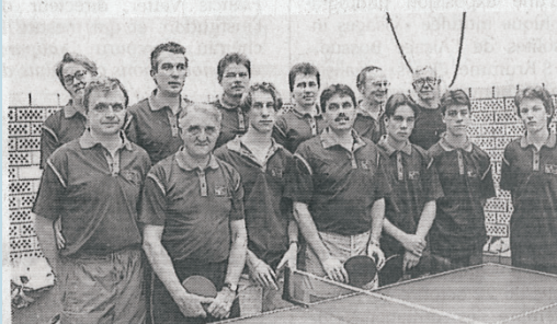
L'équipe des seniors de Drulingen.

Pour la 2 e journée du championnat en UJLL, Drulingen I en déplacement à Voyer a battu Voyer III par 10 à 0.