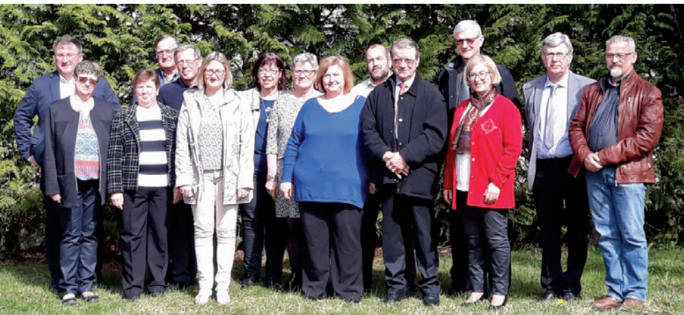
Les conseillers sortants et les conseillers actuels à l'issue du culte

Nous ne disposons pas de la liste complète des enfants qui devraient commencer leur catéchisme, par conséquent la présence effective lors de la première séance vaudra inscription. Le planning des différentes séances de catéchisme sera distribué à chacun ce jour-là.