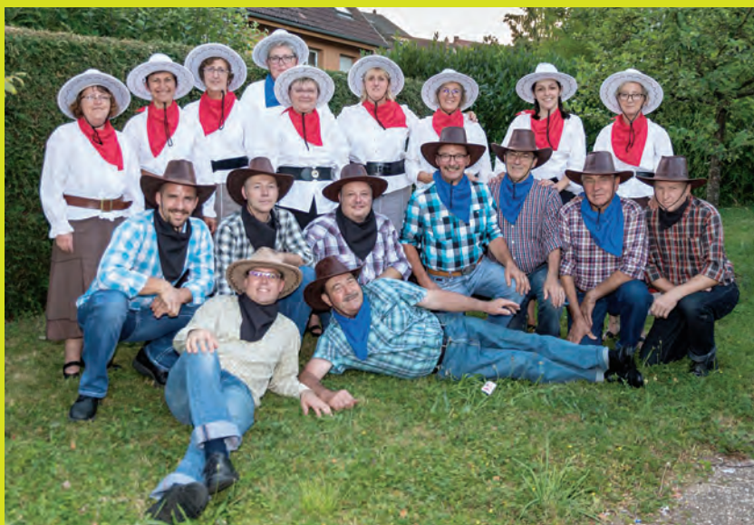
Danse du Far-West en clin d'œil à la toute première représentation