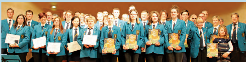
Les musiciens honorés par des médailles et des diplômes

Enfin, et pour clôturer la soirée dans la bonne humeur, une séance d'improvisation en scène libre s'est organisée spontanément sur scène avec l'interprétation dans une ambiance joviale de morceaux connus joués par un groupe de musiciens de la Philharmonie.