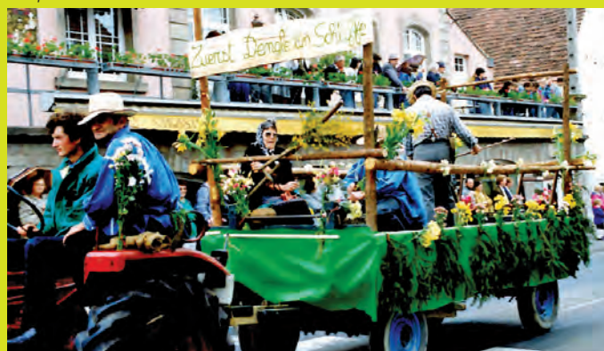
Pendant de nombreuses années, le groupe a organisé la fête de la fenaison