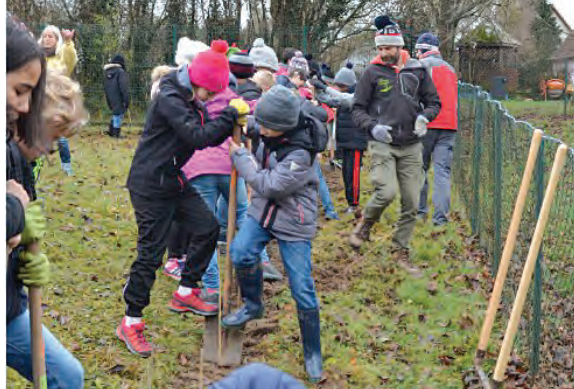
La préparation des trous de plantation

Nous sommes sortis puis nous avons mesuré la longueur de l'espace de plantation. Après ça nous avons, par groupes de 2, creusé des trous avec une pelle. Ensuite, nous avons appliqué du pralin à base de bouse de vache sur les racines pour les protéger et nous avons planté les arbres.