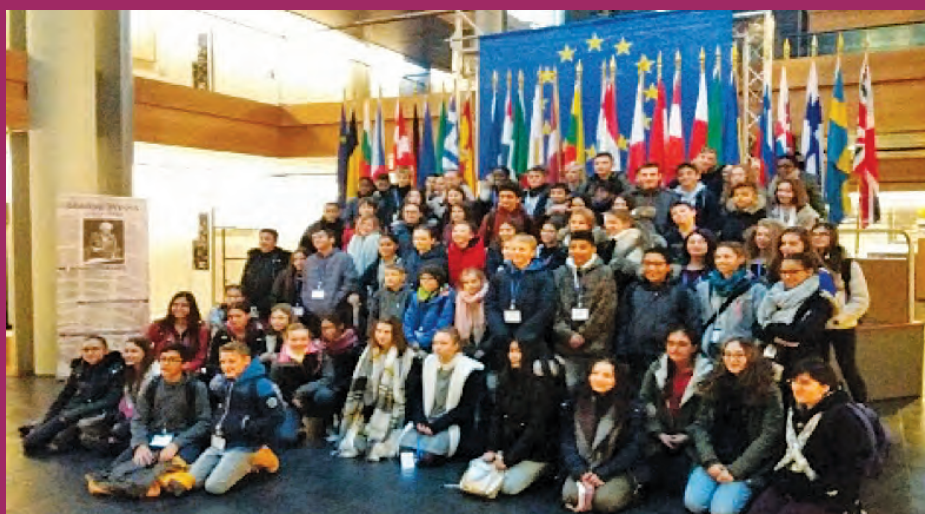
Formation des délégués au parlement européen avec les élèves de l'école européenne de Strasbourg

Apprendre à s'organiser : chaque semaine un atelier est animé par la FDMJC (partenariat avec la communauté de communes), les participants ont élaboré leur programme. Ils ont choisi une alternance entre le théâtre d'improvisation et les jeux de société.