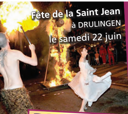
Fête de la Saint Jean à DRULINGEN le samedi 22 juin

BULLETIN D'INFORMATIONS LOCALES - JANVIER 2019 • N° 36