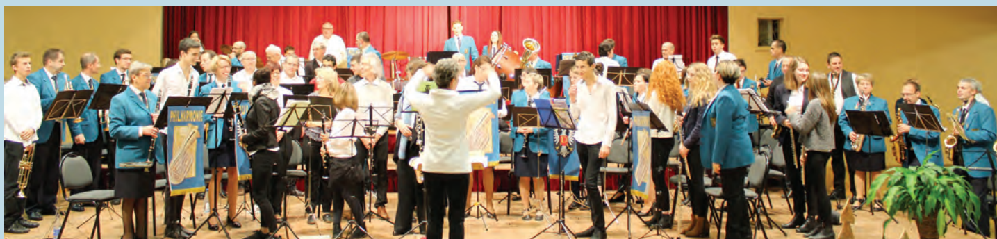
Les 2 formations réunies interprètent le final