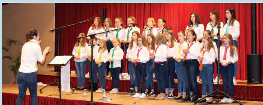
La chorale L'Echo des Anges

Les festivités se sont poursuivies le dimanche par un déjeuner musical animé par l'ensemble folklorique « Die Eichelthaler », avec un menu choucroute garnie servi par les membres du Groupe Folklorique de Drulingen et auquel les musiciens, familles et autres bénévoles étaient conviés.