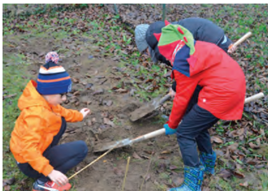
Le rebouchage des trous