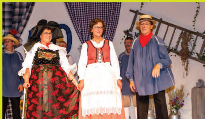
Les plus anciens danseurs